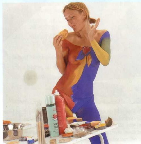
De inwendige mens wordt niet vergeten! Inmiddels is de rechter arm van blauw naar groen naar geel gepaint.