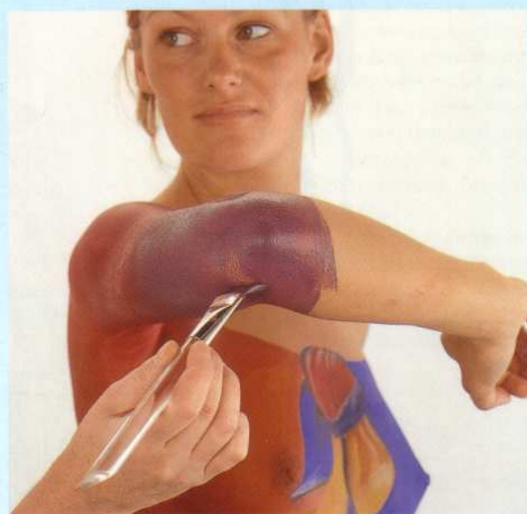
Geen plekjes vergeten! Wanneer de arm in gestrekte stand gepaint wordt, het model nadien altijd de arm laten buigen om ook de 'plooi'tjes' te painten. Zo ook bij de knieën. Hier zie je tevens de detaillering van de knoop (opgelicht en geschaduwd). En de overgang van rood naar paars. Daarna wordt het weer blauw.