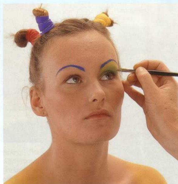
De kleuren komen terug in het haar. Voor de wenkbrauwen, ogen en lippen heb ik waterschmink gebruikt. Voor de foundation, rouge en poeder de normale visagieproducten.