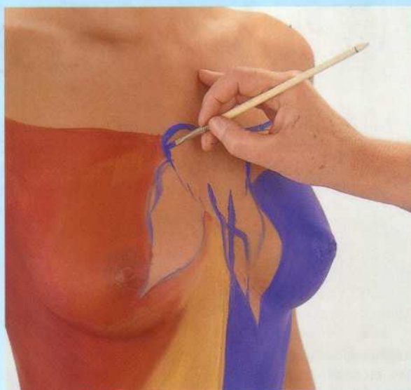
Bij het decolleté laat ik de kleuren in een knoop bij elkaar komen. Hier zie je de ruwe opzet van de knoop.